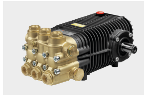
SW / TW PREMIUM