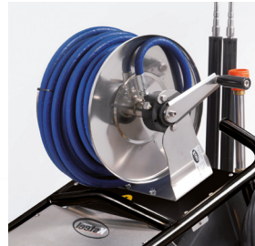
The S.S. hose reel can be mounted on request, with 20, 40, 60 m hose