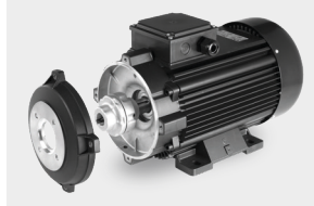
Motor-pump coupling with a flexible joint